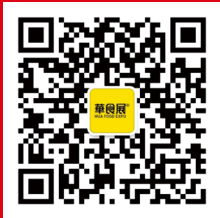
扫码关注了解展会最新资讯